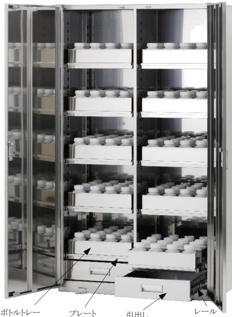
ボトルトレイ プレート 引出し レール