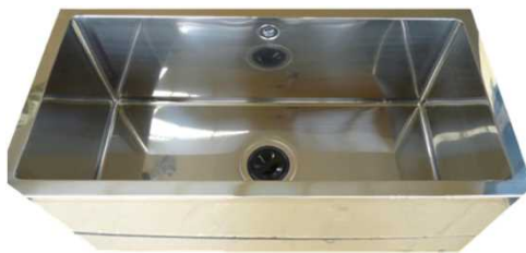
◆水槽内部と排水口の形状