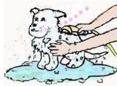
◆小動物や子犬はシャワーしてあげましょう！